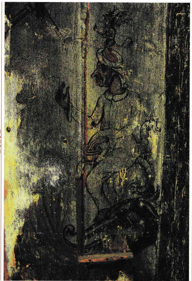
Femeia cu drac , Biserica din Deblești.

Și Tenica devenise celebră, căci acum nu mai era doar o zarzavagioaică din mahala ori femeia cu nasul mare și-atât, ci devenise stăpâna lui